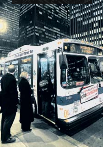
Orion-Hybridbusse sind täglich in New York im Einsatz: Daimler ist Weltmarktführer bei Hybridbussen

Darüber hinaus haben die ersten Brennstoffzellennutzfahrzeuge ihre Alltagskompetenz demonstriert. 30 mit Brennstoffzellenantrieb ausgestattete Mercedes-Benz-Stadtbusse „Citaro“ haben europaweit bis heute insgesamt über zwei Millionen Kilometer zurückgelegt, eine beachtliche Laufleistung der Busse, die das Straßenbild moderner und innovativer Großstädte wie etwa Stuttgart, Amsterdam oder Hamburg aktiv - und vor allem umweltfreundlich - mitgestalten.